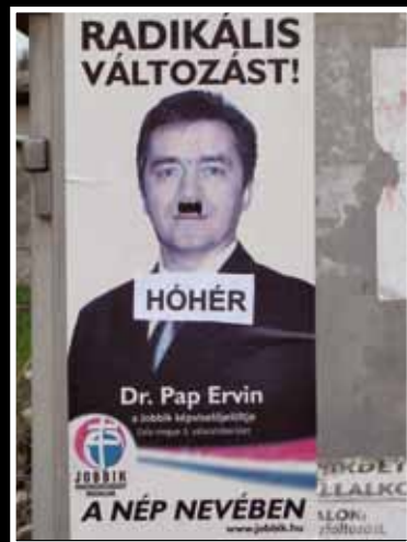
Keszthely-Kertváros, Csabagyöngye u.