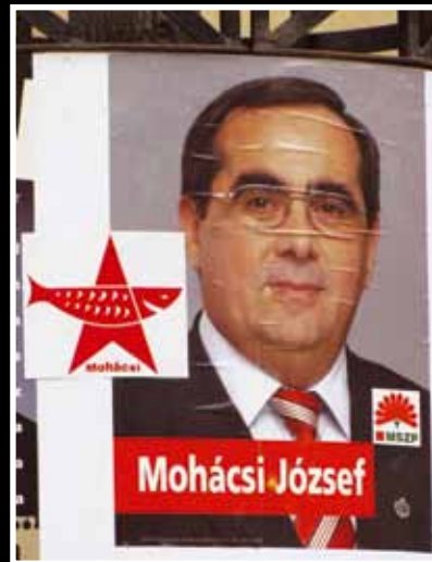
Hévíz, Petőfi S. u.