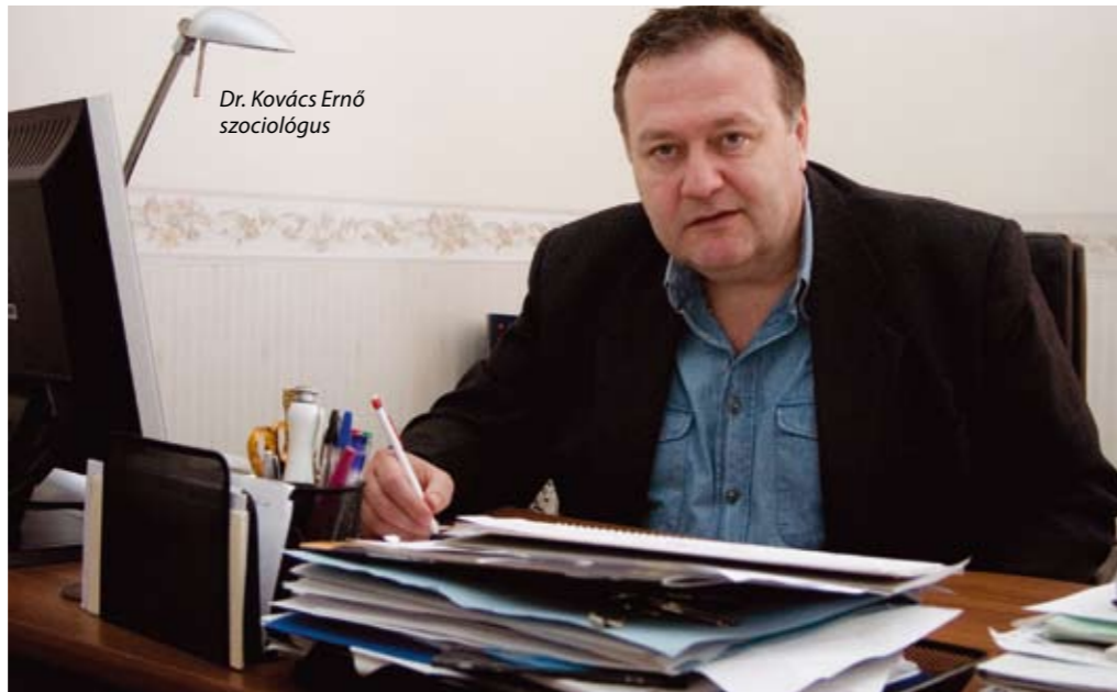
Dr. Kovács Ernő szociológus

A magyarországi nyugdíjrendszer alapvető változtatásra szorul. Ha nem lépünk időben, 2020-ra összeomlik az egész rendszer – véli Kovács Ernő szociológus. A nyugdíjasok és a nyugdíjszerű ellátásban részesülők száma a huszadik század második felében folyamatosan emelkedett – állapítja meg a KSH összefoglaló jelentése. Hazánkban 3,9 millió alkalmazott van, de ha ebből levonjuk a 800 ezer állami alkalmazottat, akkor kiderül, hogy a magánszférában alkalmazott 3,1 millió ember tartja el a nyugdíjban vagy közellátásban részesülő hárommillió eltartottat. Van továbbá 350 ezer munkanélküli és félmillió rendszeren kívüli ember, ők aktív korúak, de nincsenek gyesen, nem kapnak rokkantnyugdíjat, nem tanulnak, és semmilyen nyugdíjgосultságot nem gyűjtenek maguknak. Néhány évtizeden belül ugyanis tömegessé válhat az időskori szegénység, mert a jelenlegi munkavállalók közül sokan nem szerzik meg a nyugdíjhoz szükséges minimális szolgálati időt. Másrészt, ha tartósan minimálbérrel vagyunk bejelentve, alacsony lesz a nyugellátásunk (a mai minimálbér után 26-28 ezer forint), ha pedig évekig feketén vállalunk munkát, akár külföldön, akár itthon, megnézhetjük magunkat 62 év felett. A szociális háló segít majd rajtunk? Valamilyen szinten igen, mivel a társadalom felelőssége a hátrányos helyzetűek megsegítése, de ha a társadalom is bajban van, akkor ez egyre kisebb lesz.