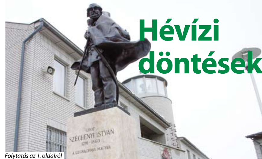
Folytatás az 1. oldalról