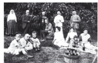
Egy fotó a múlt század elejéről, a kép középpontjában Herman Ottó természetudós, etnográfus ül, a jobb szélén Csák Árpád múzeumalapító

Az idei kiállítás november 16-án, pénteken 18 órakor nyílik meg a gyenesdiási községházán. A fő hangsúlyt ezúttal az archív fotók kapják, a helyben gyűjtött képanyag mellett a Balatoni Múzeum gyűjteményéből is láthatunk