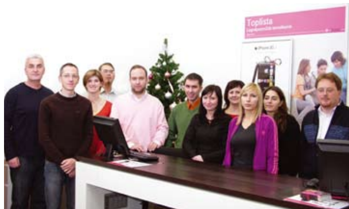
Kellemes karácsonyi ünnepeket és boldog új évet kíván a Nivo Kft. minden dolgozója.