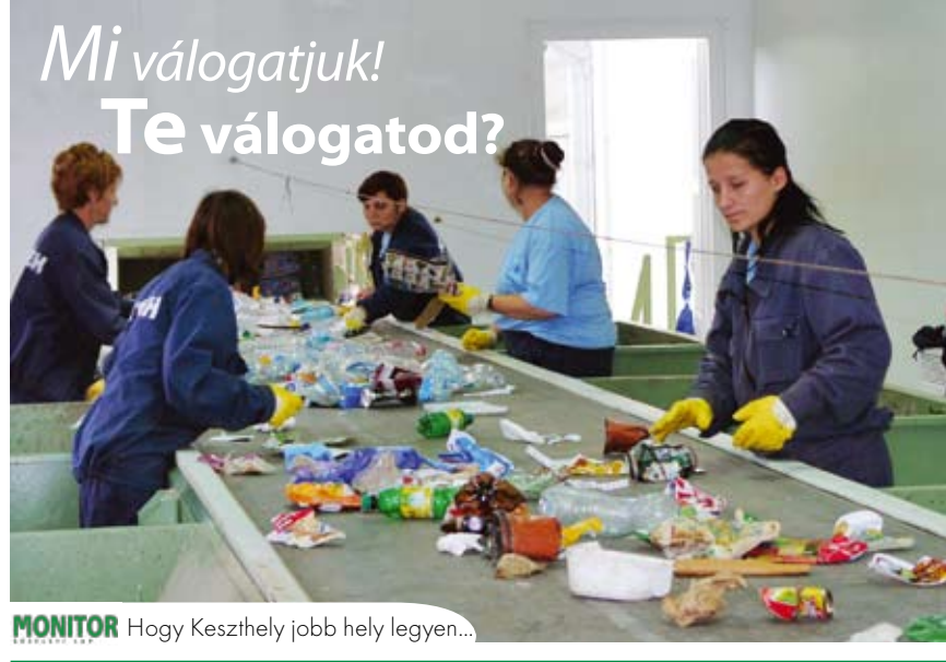
MONITOR Hogy Keszthely jobb hely legyen...